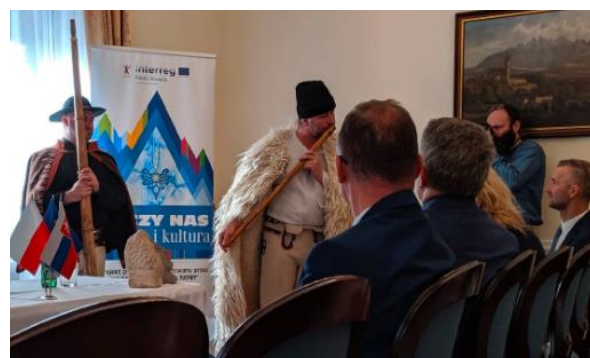
Seminarium i warsztaty nt. dziedzictwa kulturowego na pograniczu, Nowy Targ 22.11.2019 r.