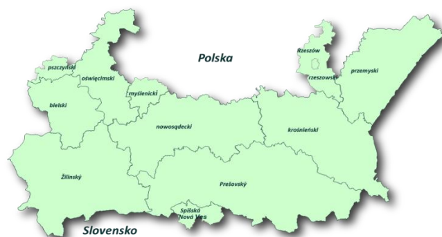
Obszar wsparcia programu

Program wspiera działania z zakresu ochrony i rozwoju dziedzictwa przyrodniczego i kulturowego, przebudowy infrastruktury drogowej usprawniającej komunikację między Polską a Słowacją oraz dostosowanie edukacji zawodowej do wymogów transgranicznego rynku pracy. Przyczynia się w ten sposób do rozwoju pogranicza polsko-słowackiego.