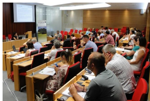
Szkolenie dla Beneficjentów Programu, Preszów, 13.06.2019 r.