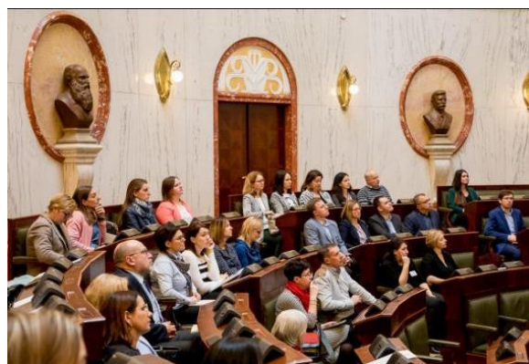
Regionalne seminarium informacyjne nt. EWT w województwie śląskim, Katowice 29.11.2019